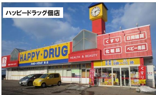
ハッピードラッグ佃店