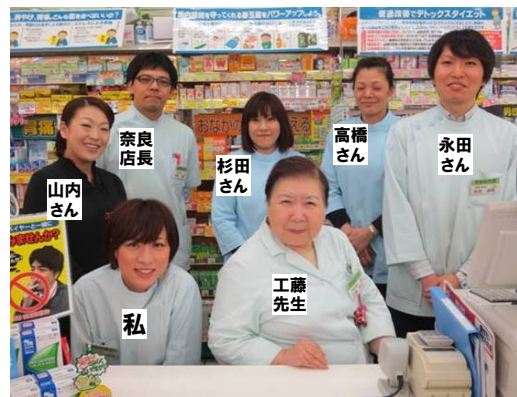
【頼りになる先輩スタッフ】

店舗のスローガンは『 地域密着度 全店NO1 』 お客様へ思いやりの気持ちを持って接客、応対をしています。